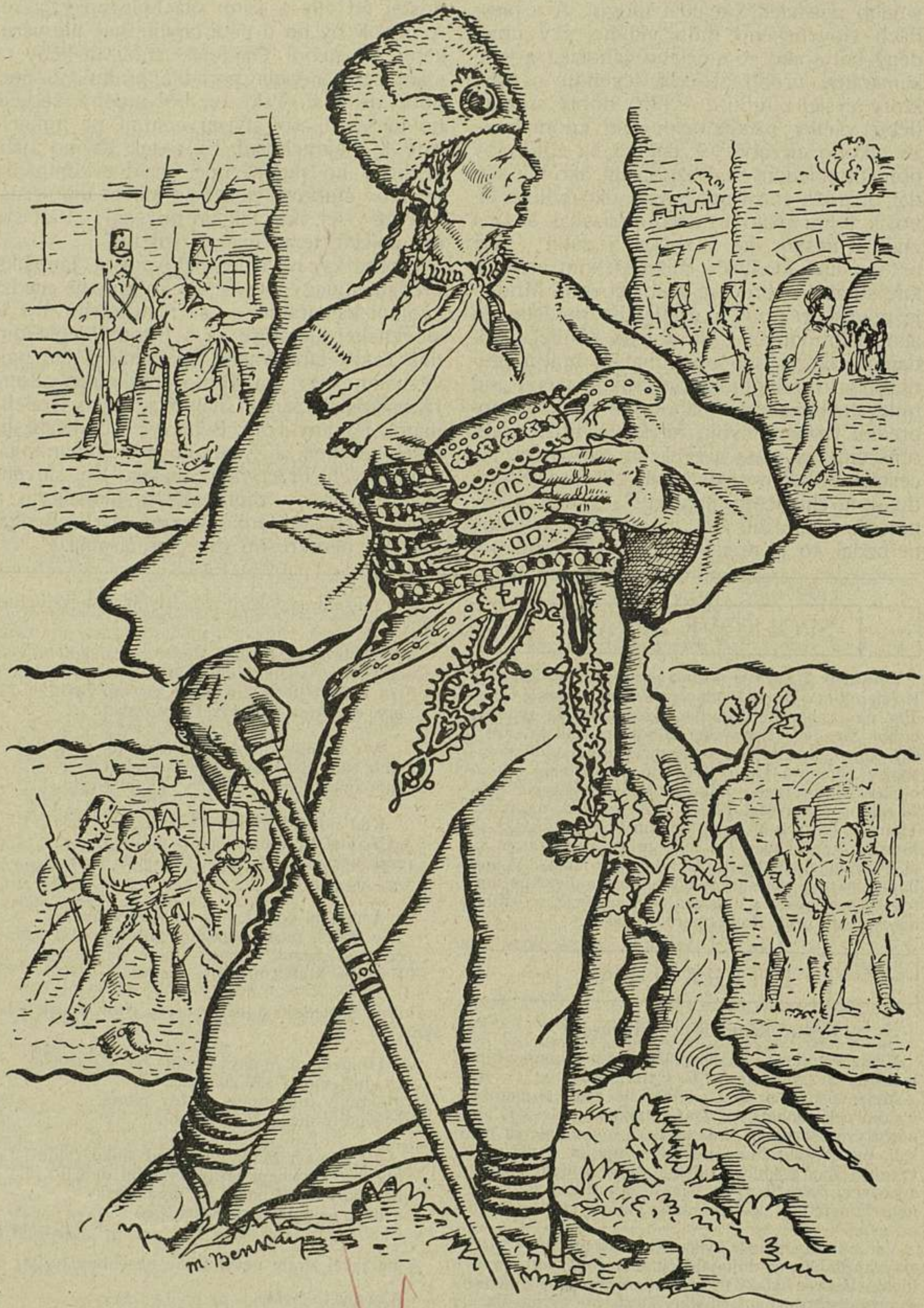
M. Benka: Jánošík.